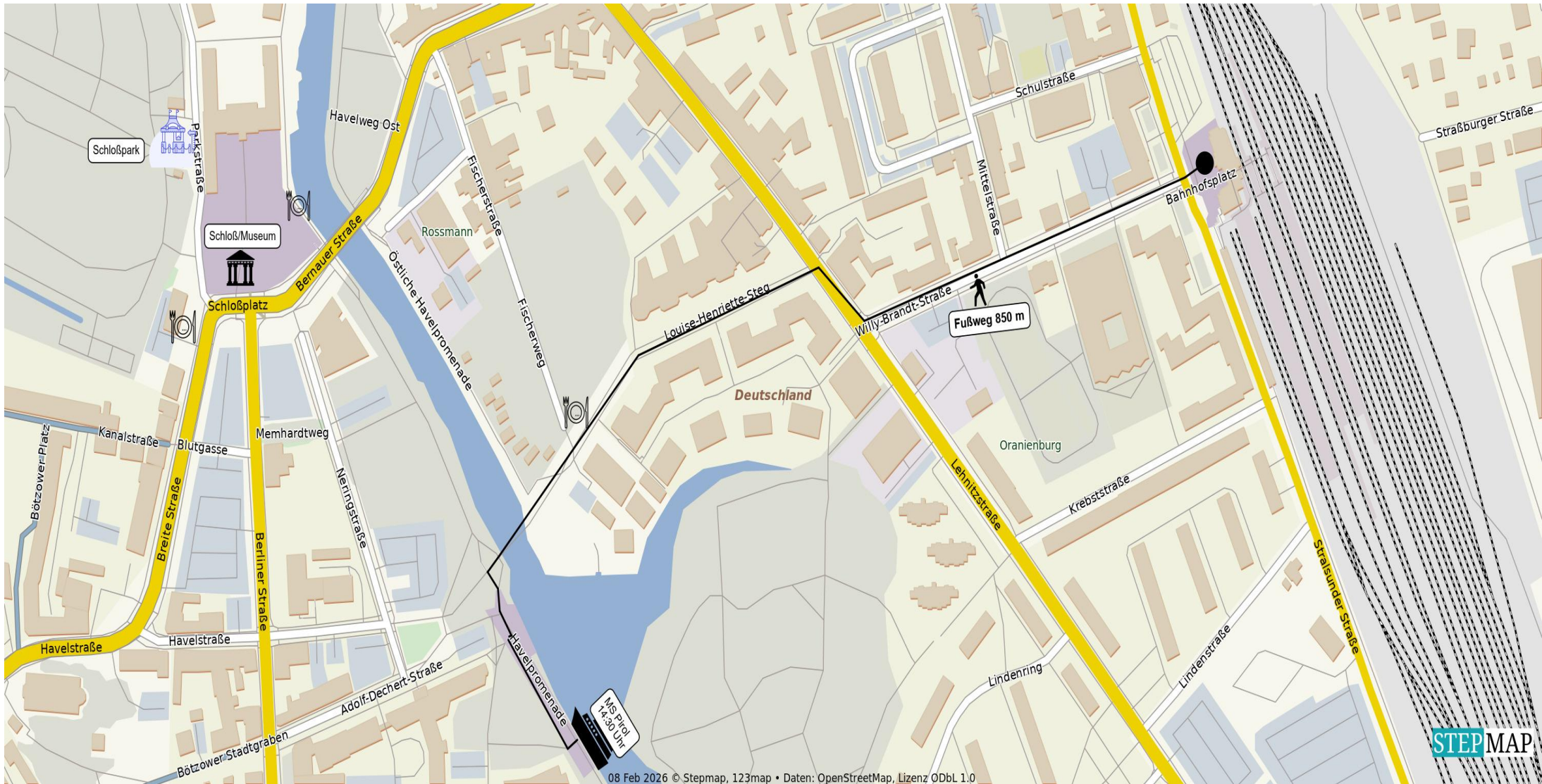
Fußweg zum Schiffsanleger